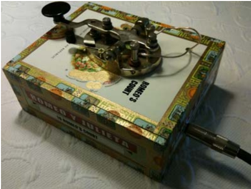
Morse Code Trigger (Joythief)